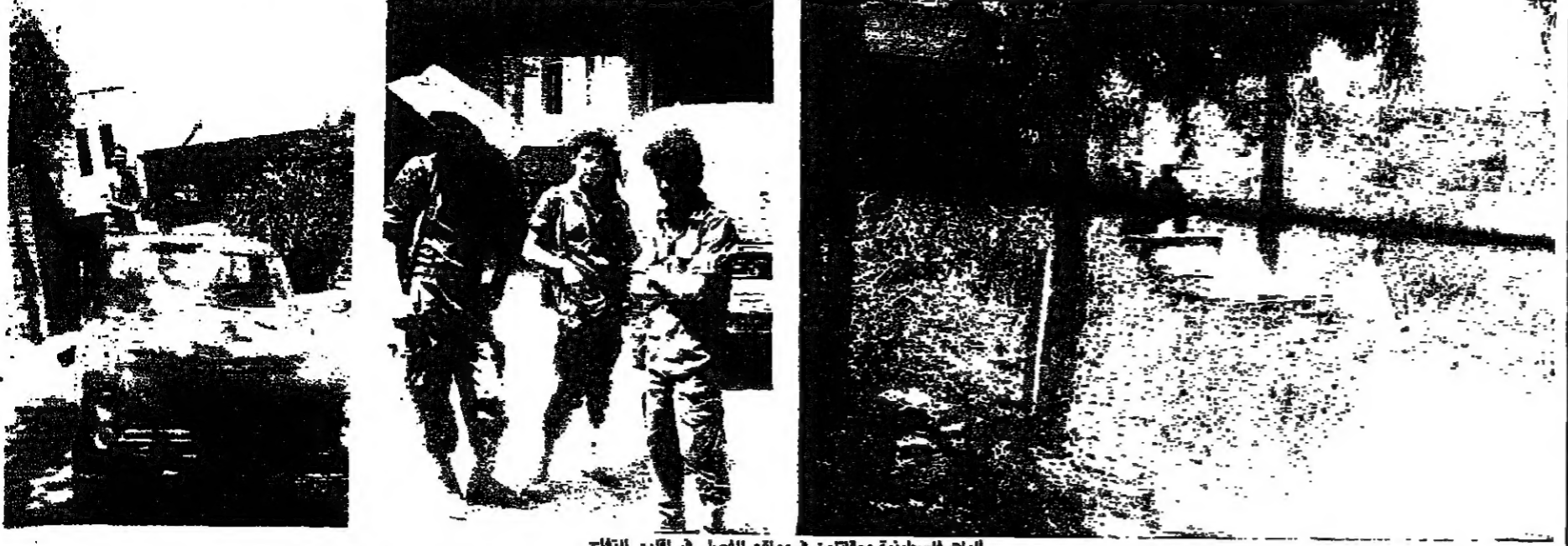
البيات الفلسطينية ومقاتلون في مواقع الفصل في اقليم التفاح